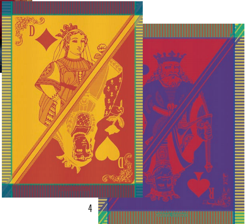
1. Château de cartes ocre 2. Mille tingari terre rouge 3. Calendrier 2020 4. Carte reine festival & Carte roi festival 5. Château de cartes ocre