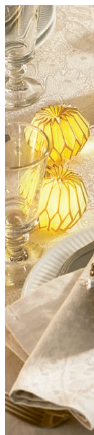
1. Isaphire diamant rose 2. Mille charmes rose fumé 3. Mille isaphire parchemin 4. Opéra blanc 5. Jardin des roses parme