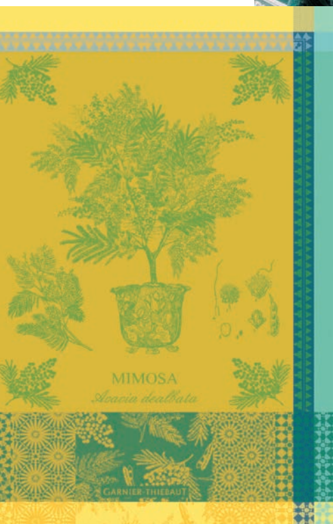
1. Fontainebleau vert profond 2. Mille automnes mousse 3. Éléa émeraude 4. Eucalyptus canard 5. Mimosa jaune 6. Fontainebleau vert profond