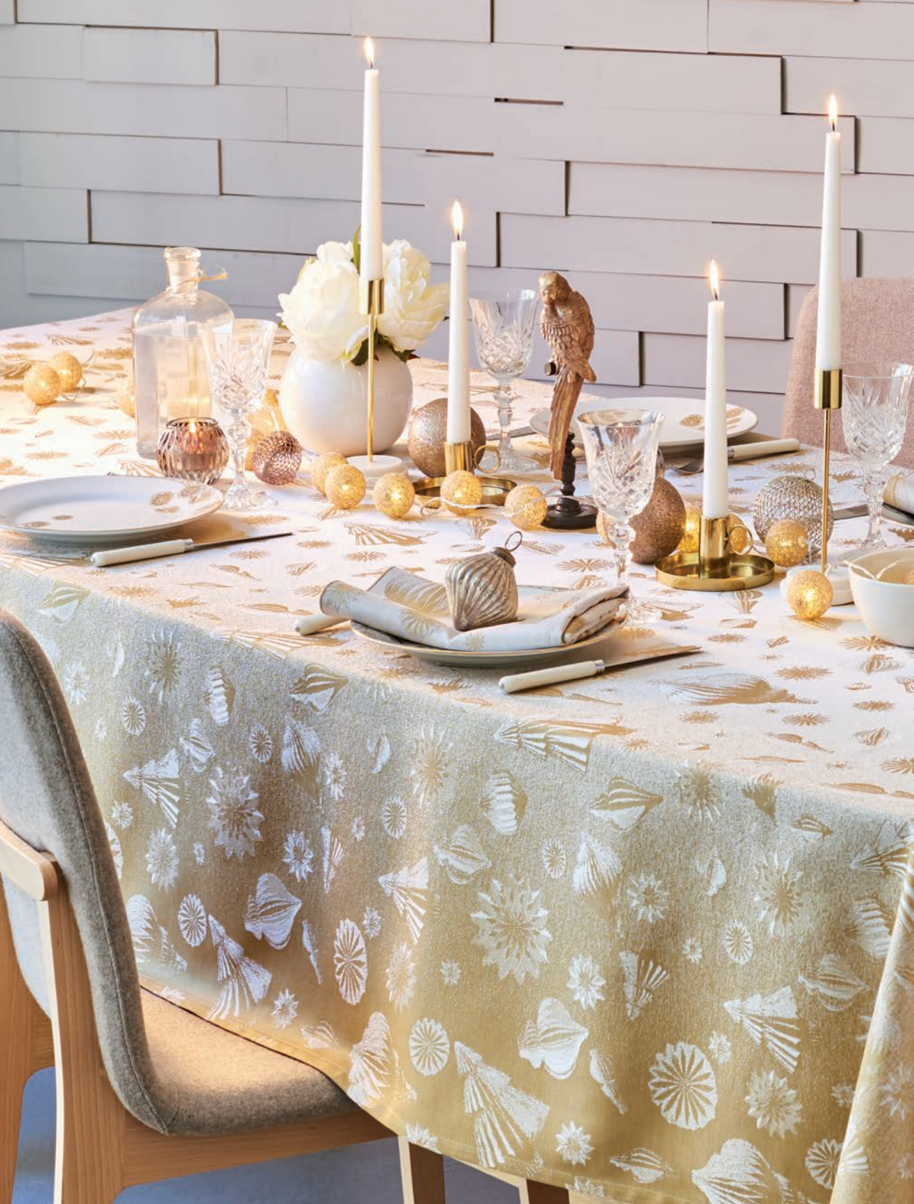
Mille Merry or - 100% coton