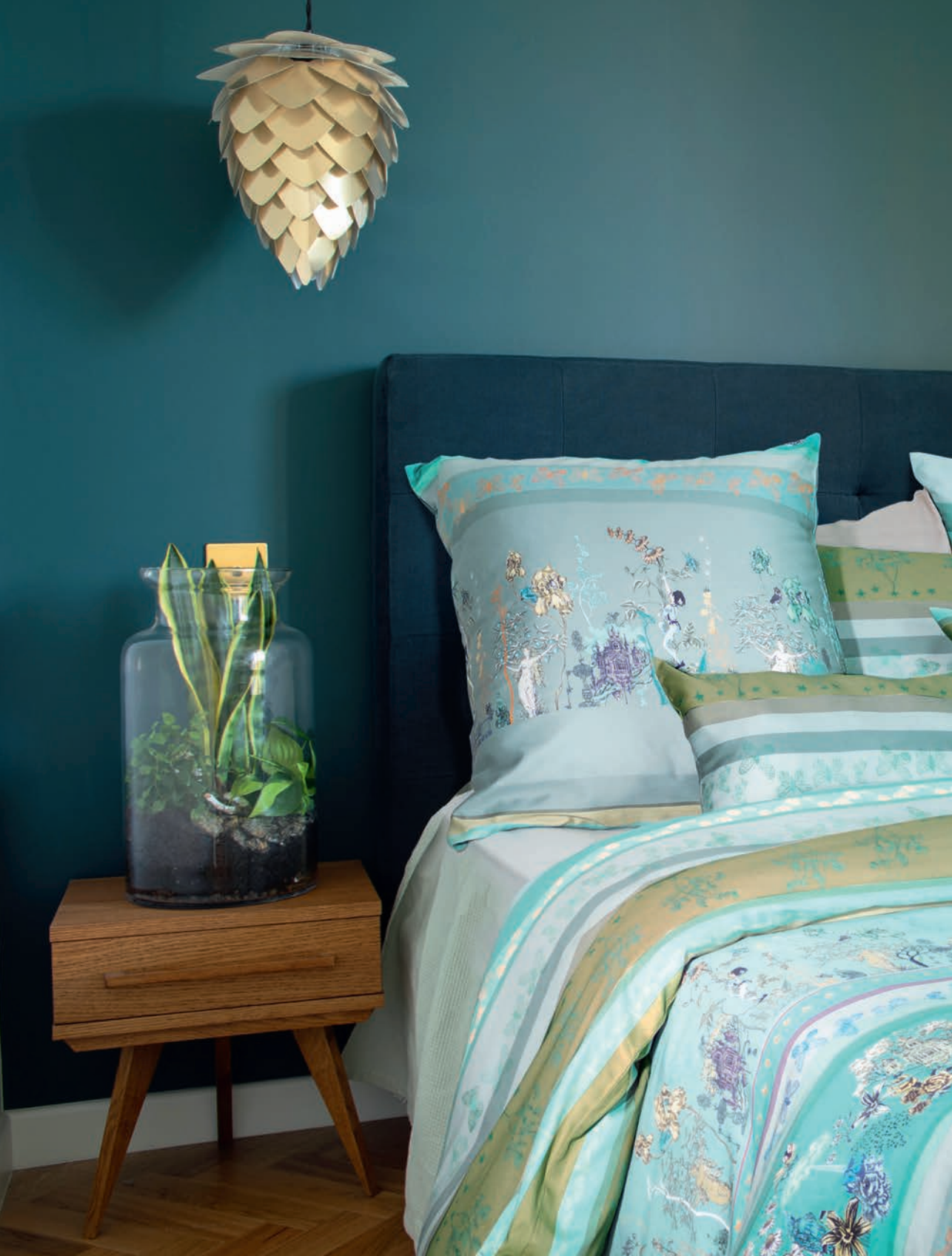
Jardin enchanté aqua - satin 300TC