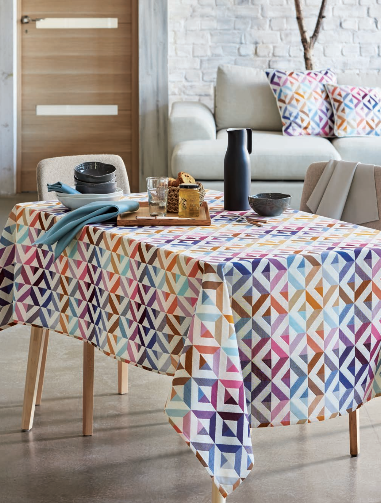
Mille twist warm - 100% coton