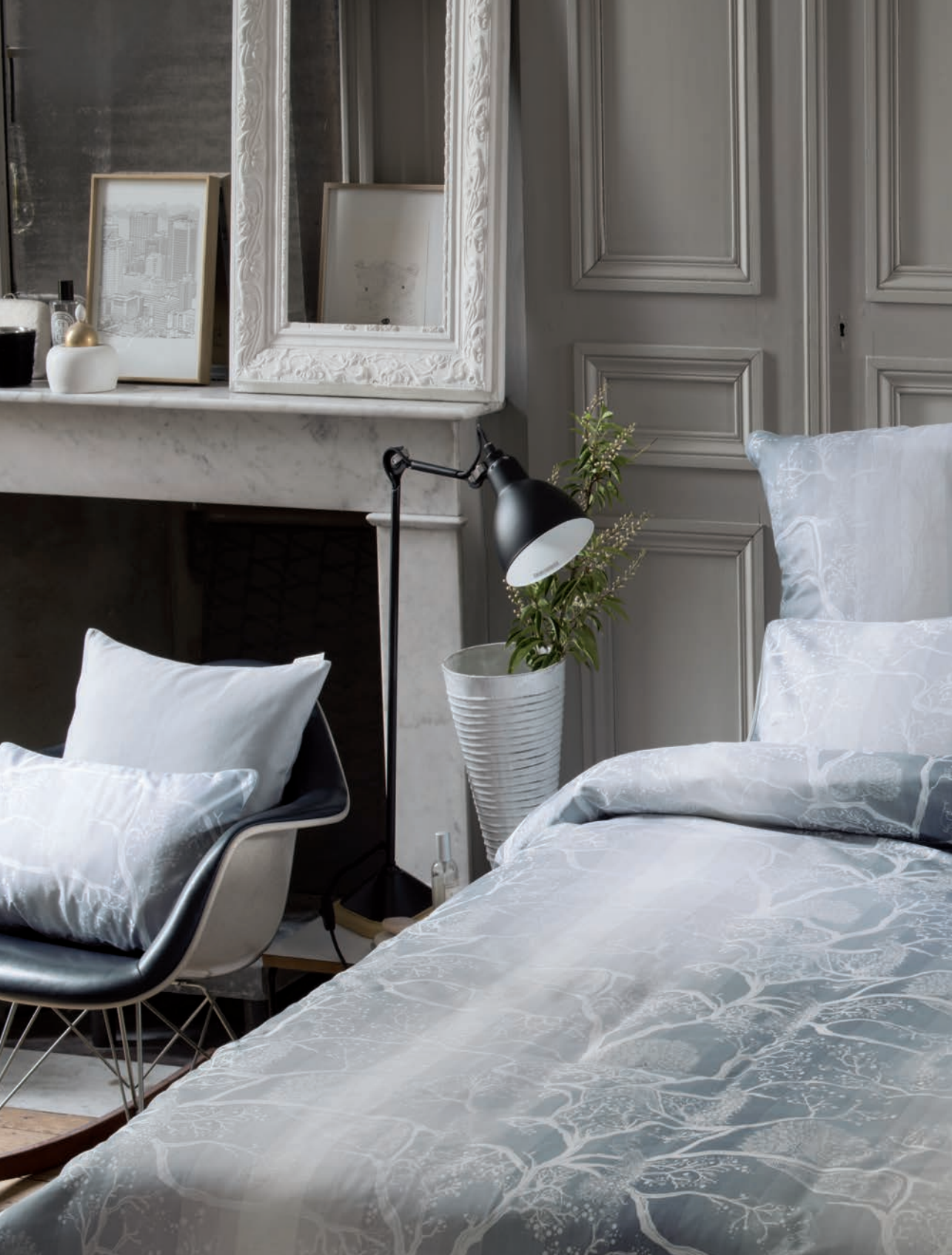
Parade nuage - satin 330TC