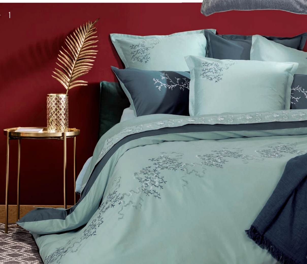
1. Aqua coral mint 2. Palazzina fusain 3. Cassandre grenat 4. Galerie des glaces argent 5. Cassandre grenat 6. Lysandra brume