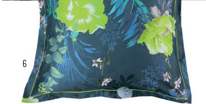
1 & 2. Estampes curry 3. Mille branches paon 4. Mille Gaïa floralies 5. Serres royales vert empire 6. Jardin tropical bleu canard