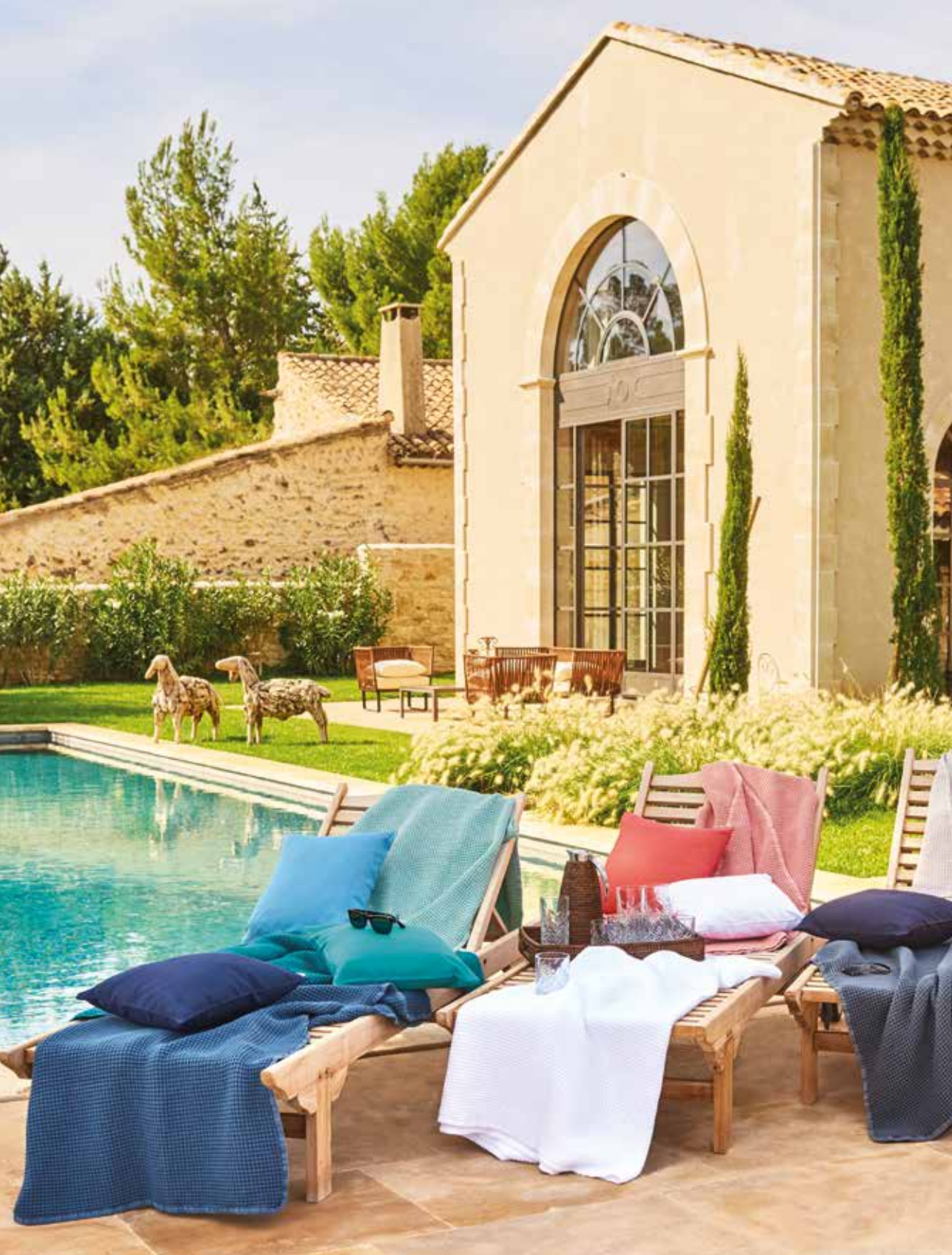
Plaids Santorin - nid d'abeille stone wash & Coussins Confettis - 100% coton / 100% cotton