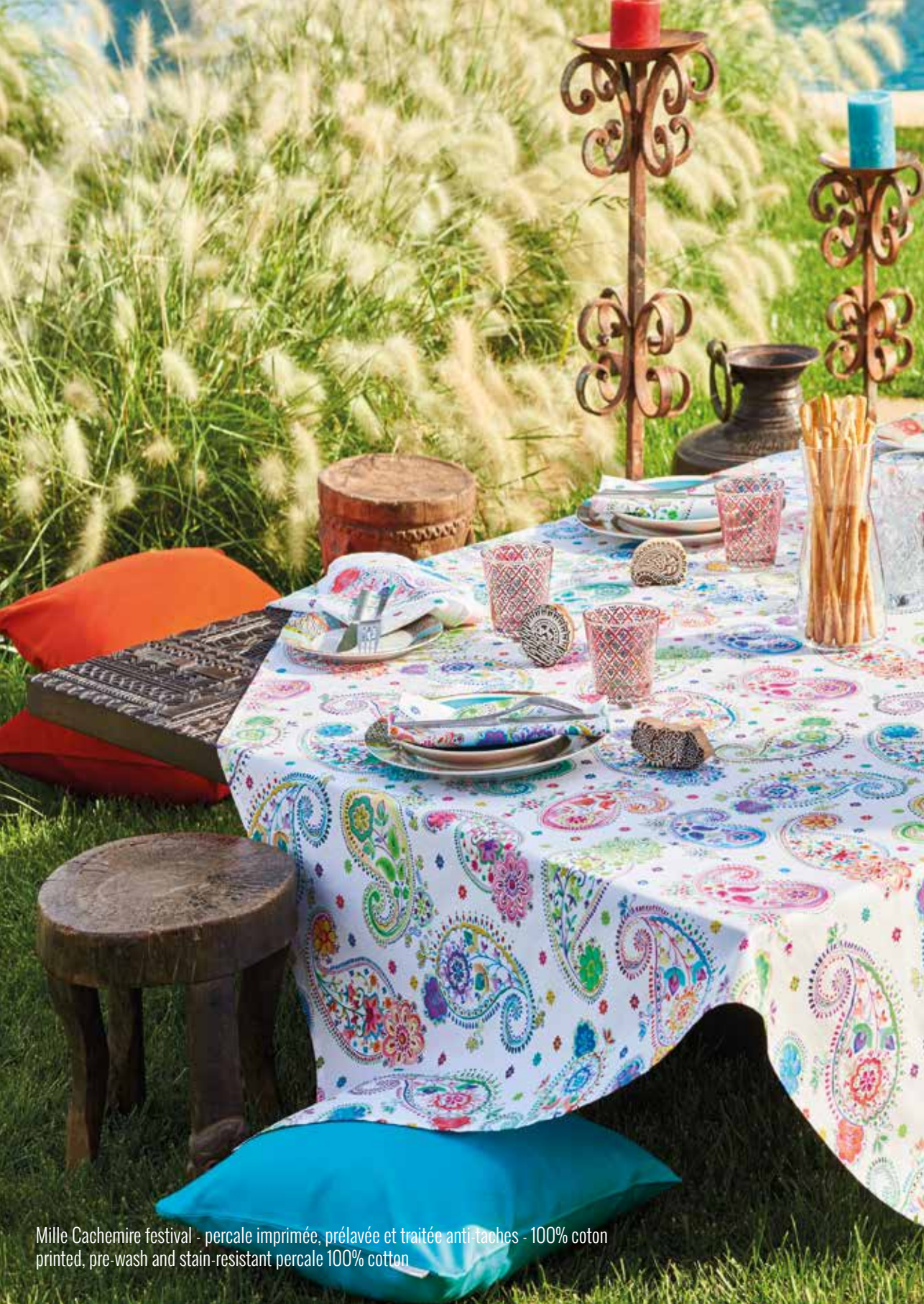
Mille Cachemire festival - percale imprimée, prélavée et traitée anti-taches - 100% coton printed, pre-wash and stain-resistant percale 100% cotton