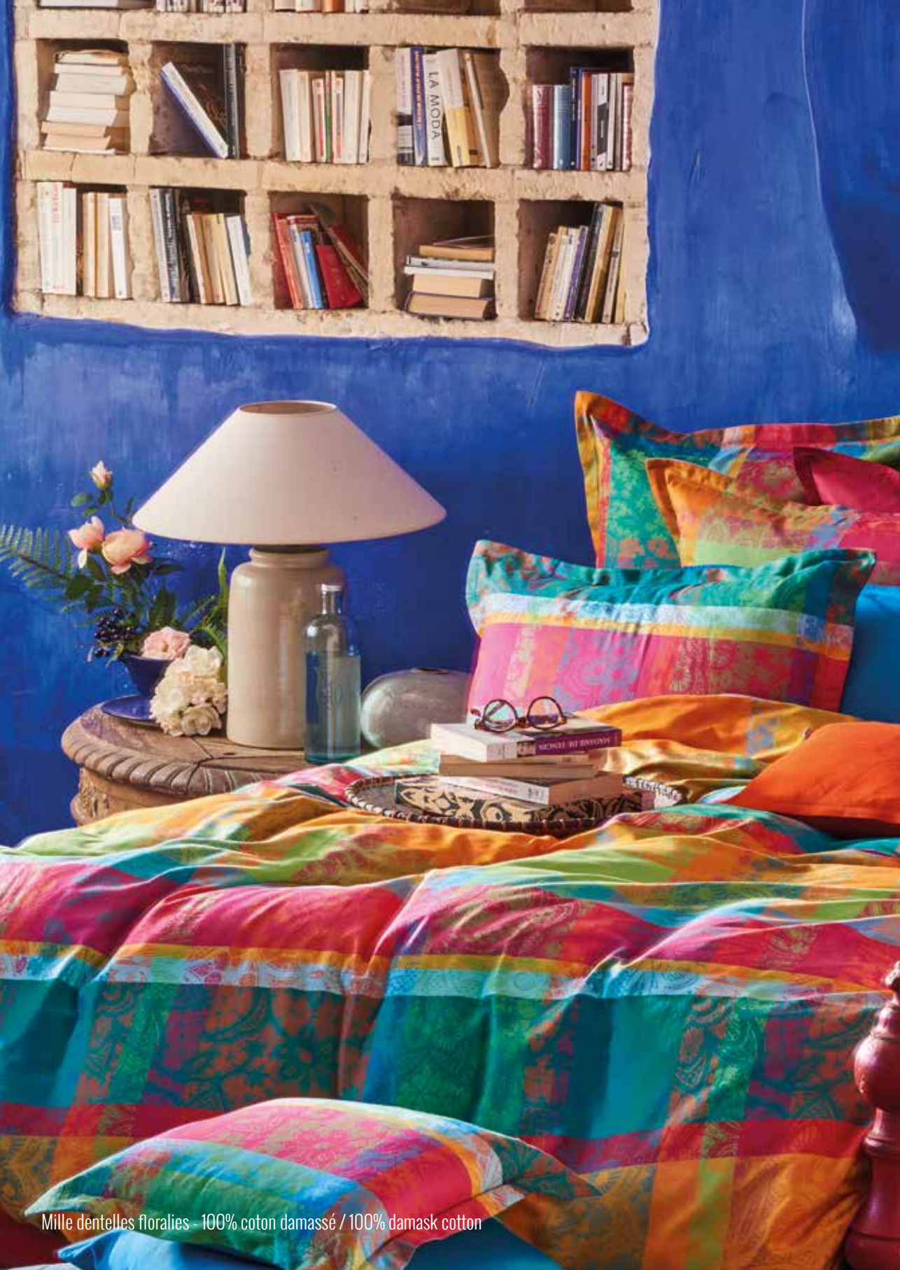
Mille dentelles florales - 100% coton damassé / 100% damask cotton