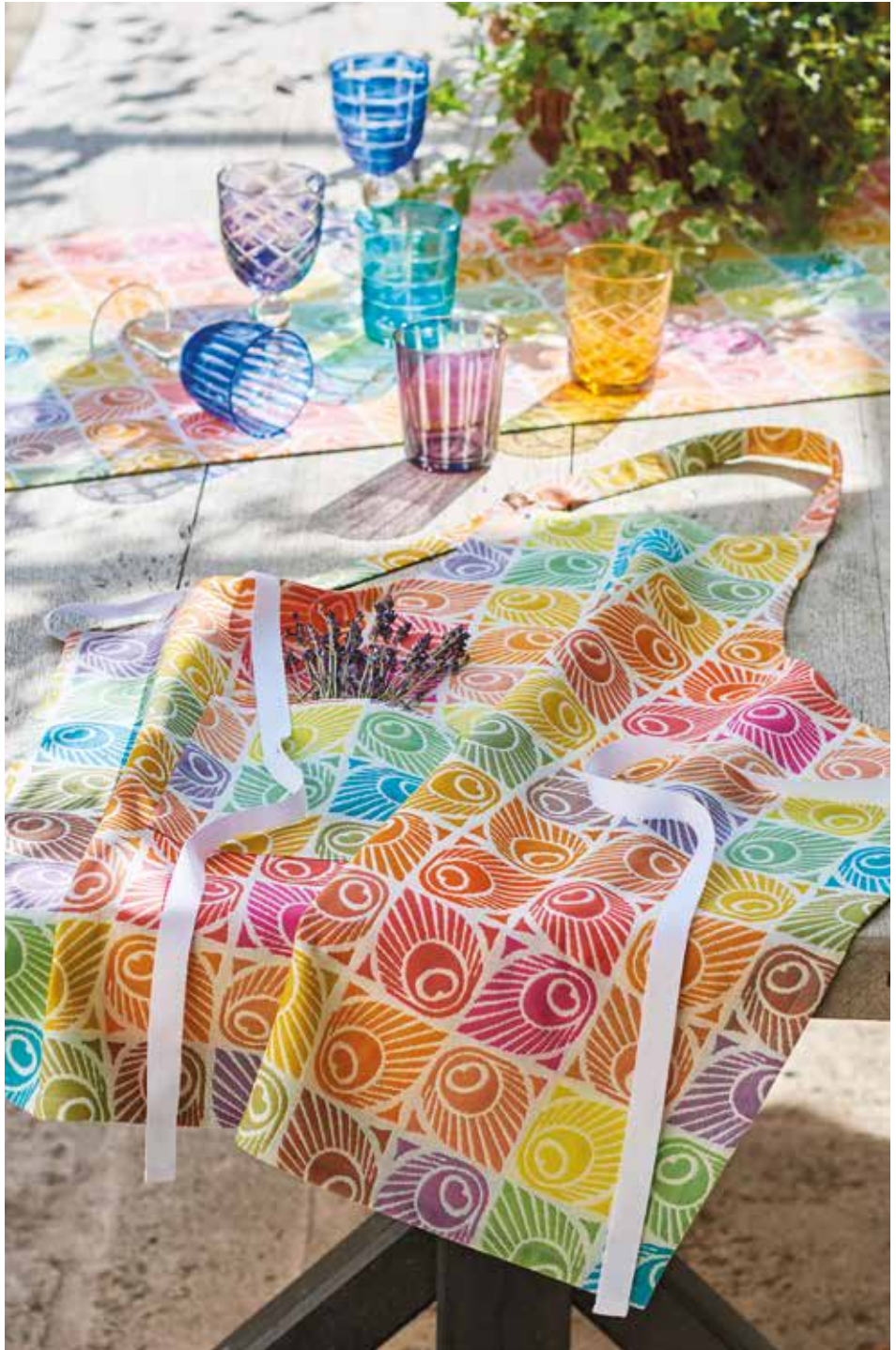
Mille paons festival - 100% coton damassé (existe en enduit) 100% damask cotton (also available in coated cotton)