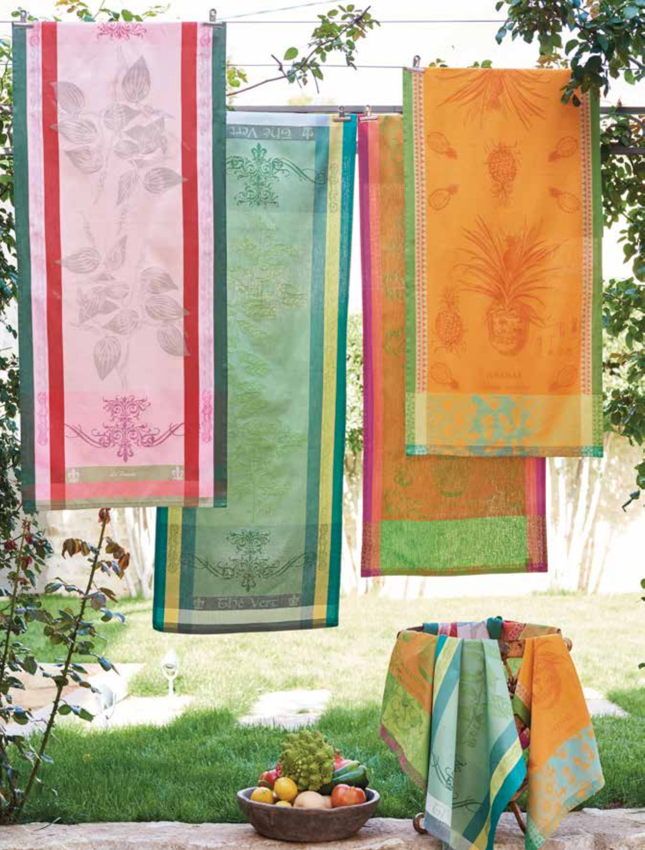
Brin de poivre rose - Brin de thé vert - Mandarinier en pot orange - Ananas en pot jaune soleil 100% coton damassé / 100% damask cotton