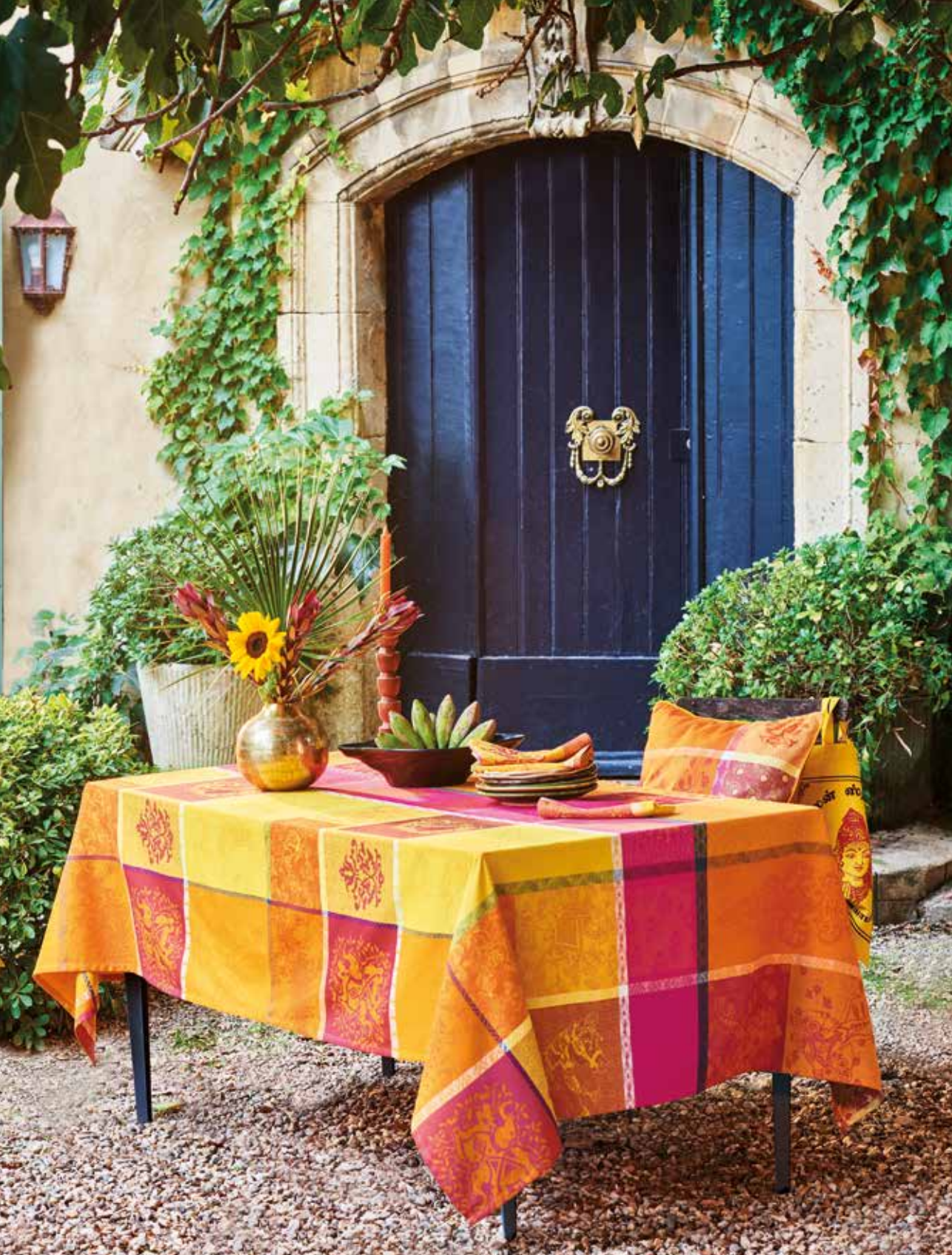
Mille holi épices - 100% coton damassé (existe aussi en enduit) / 100% damask cotton (also available in coated cotton)