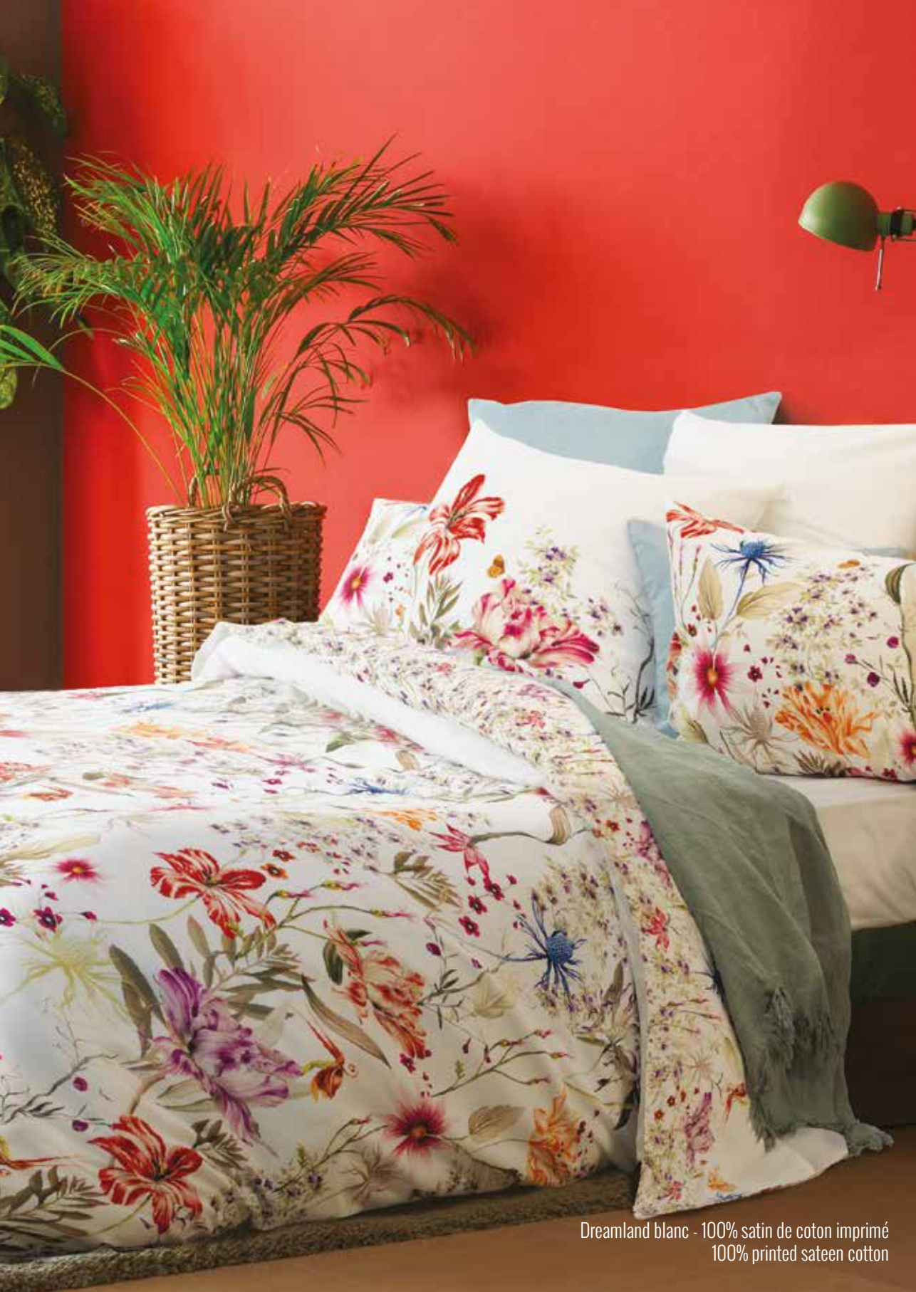
Dreamland blanc - 100% satin de coton imprimé 100% printed sateen cotton