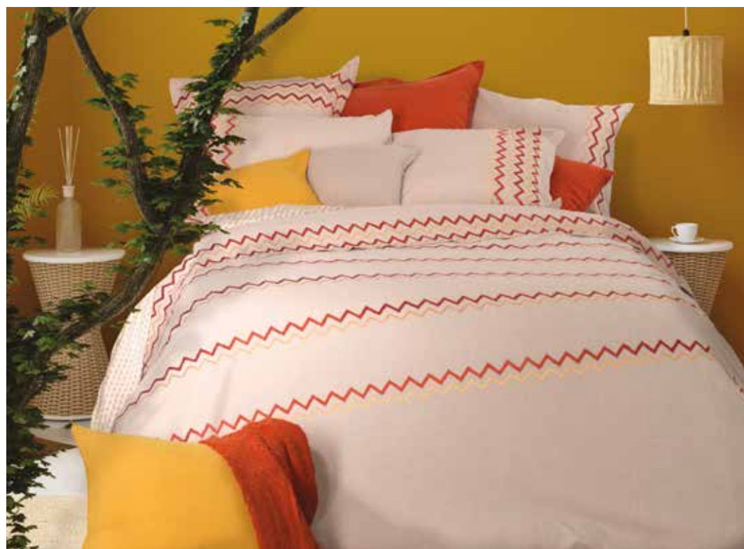
Zig Zag curry - percale "effet chambray" brodé 100% coton / chambray-like embroidered percale 100% cotton