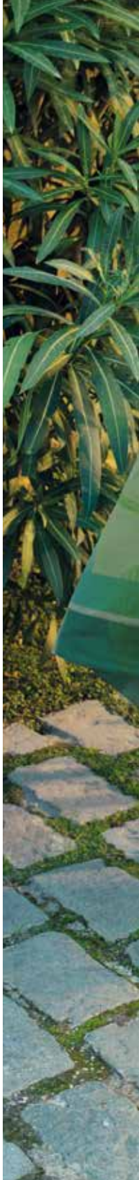
Pistol aqua - 100% satin de coton brodé / 100% embroidered sateen cotton