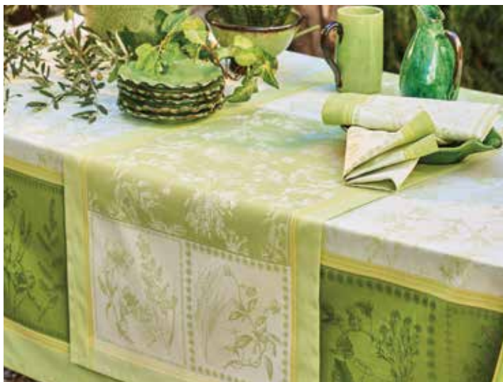
Herbora prairie - 100% coton damassé / 100% damask cotton