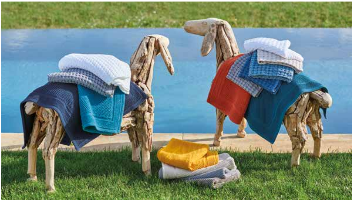
Tapis Antica & éponges nid d'abeille Cordoue