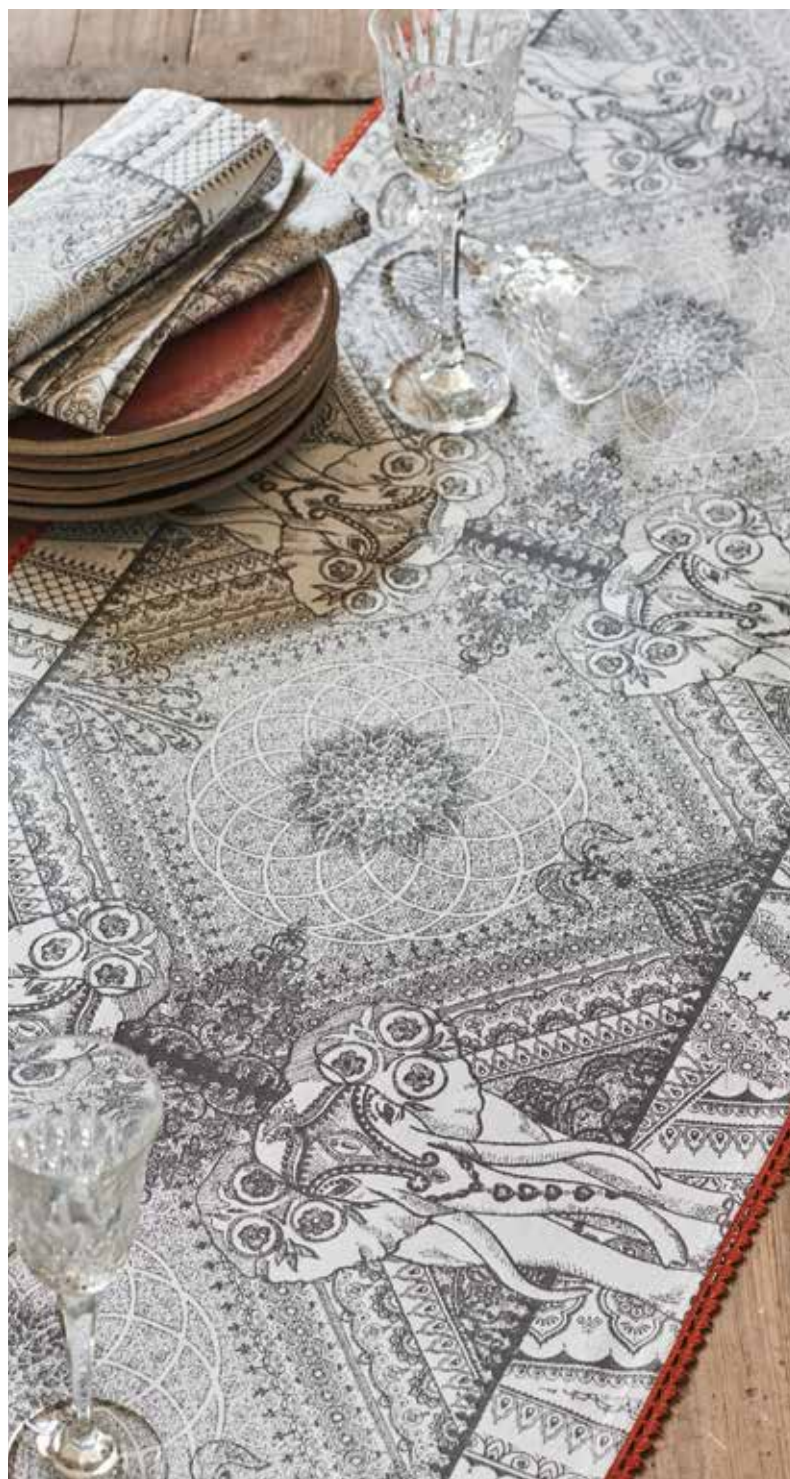
Jodhpur noir - 100% coton damassé / 100% damask cotton