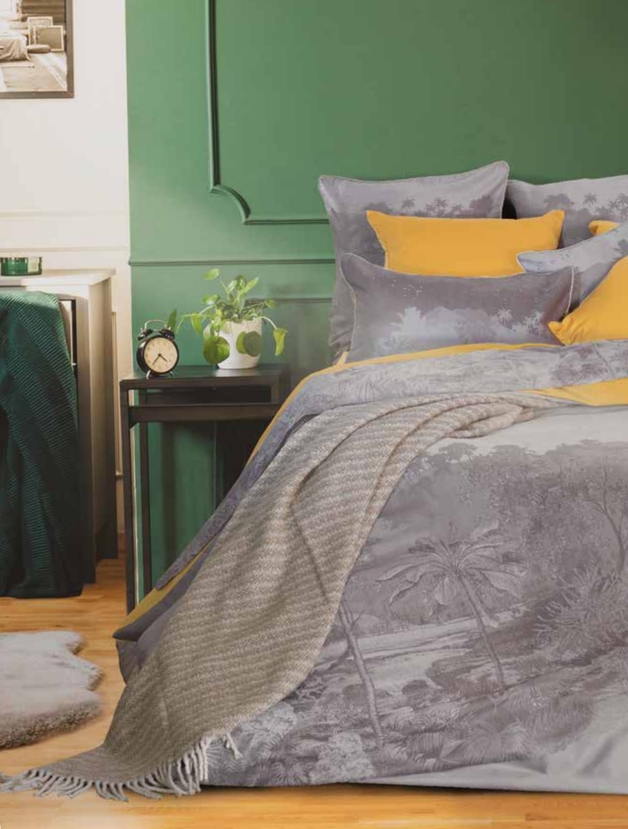
Sous les tropiques parchemin - 100% coton damassé / 100% damask cotton