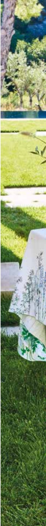
Jardin aromatique floraison - Métis lavé imprimé / pre-wash printed half linen