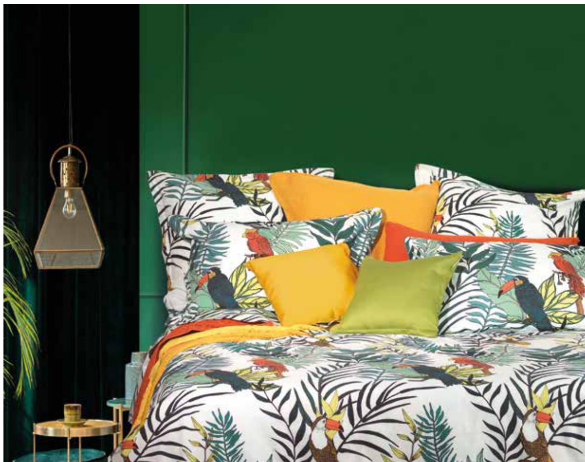
Panama blanc - percale imprimée 100% coton printed percale 100% cotton