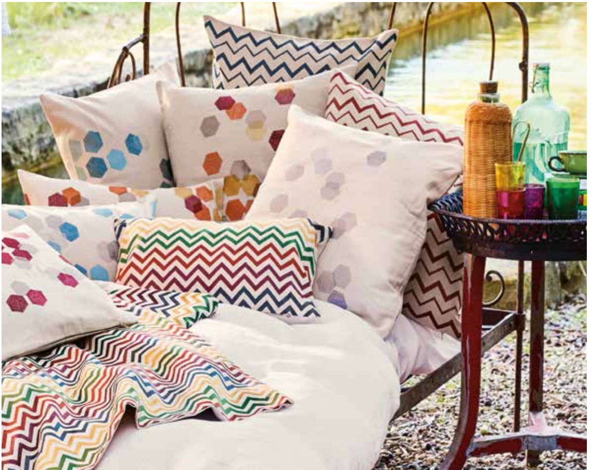
Coussins Zig Zag & Hexagones