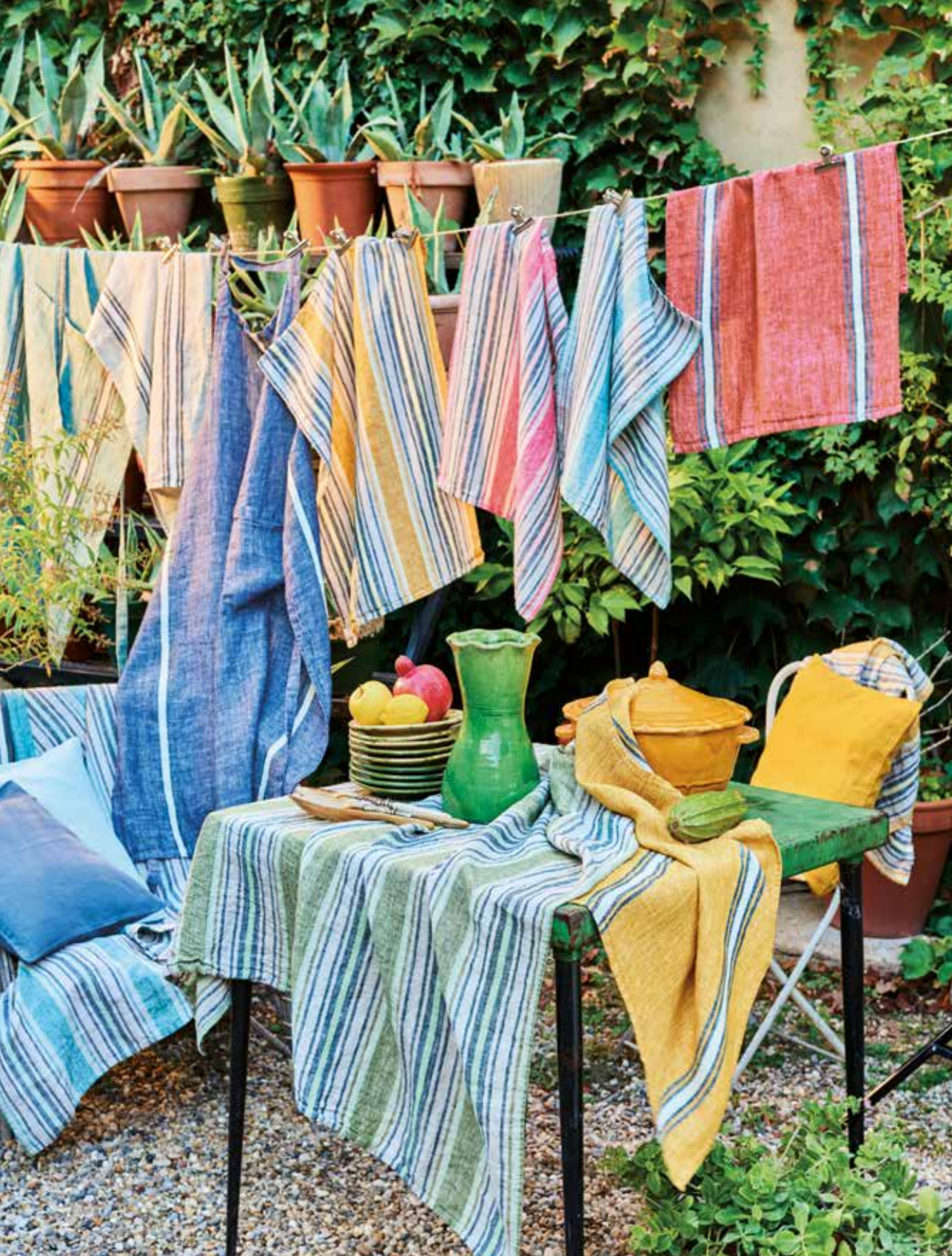
Sombrilla & Costa - 100% lin lavé / 100% pre-wash linen