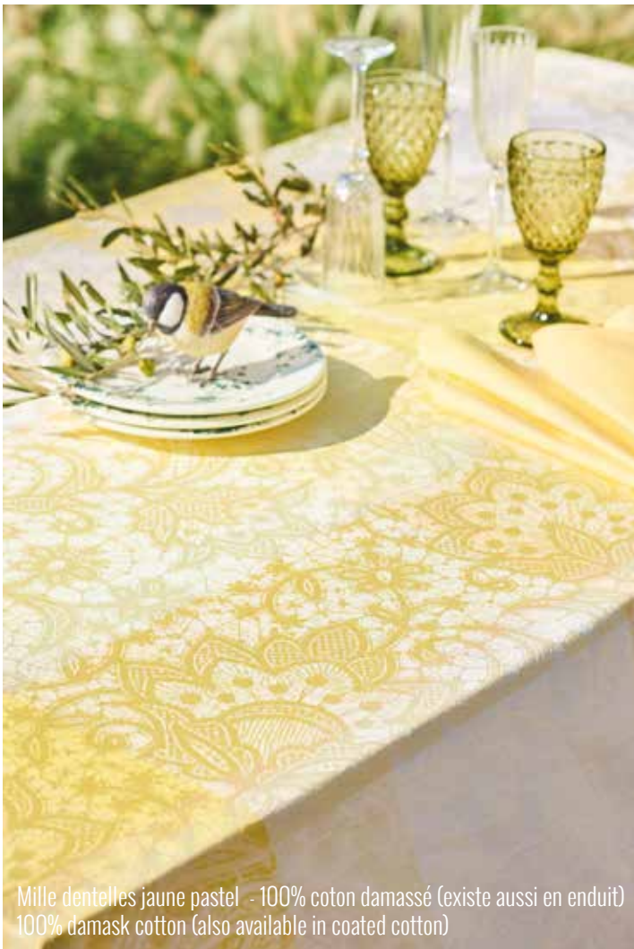
Mille dentelles jaune pastel - 100% coton damassé (existe aussi en enduit) 100% damask cotton (also available in coated cotton)