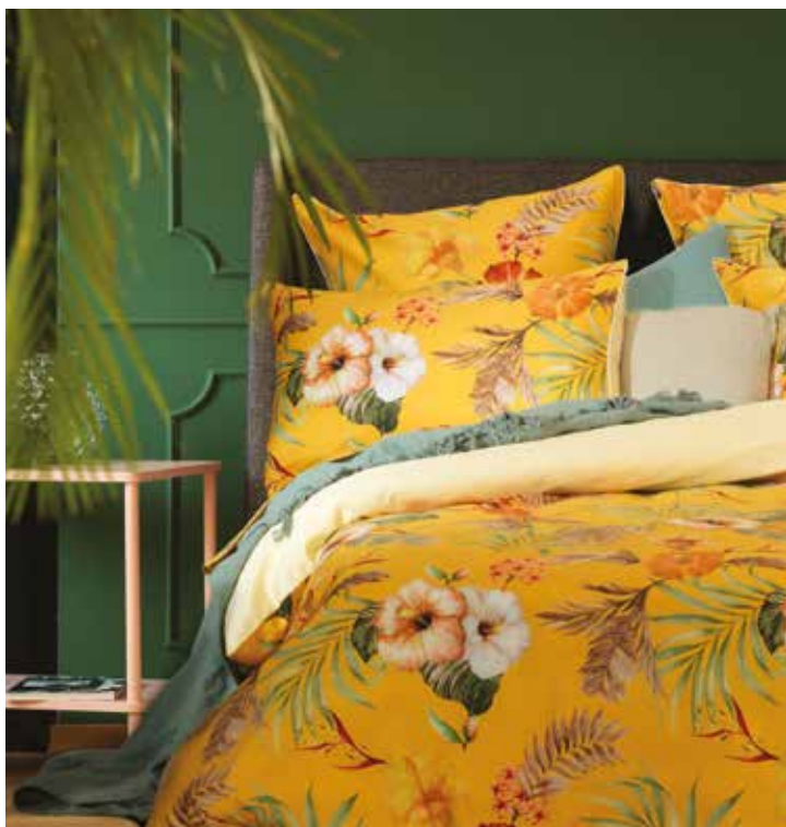
Saranda safran 100% satin de coton imprimé 100% printed sateen cotton