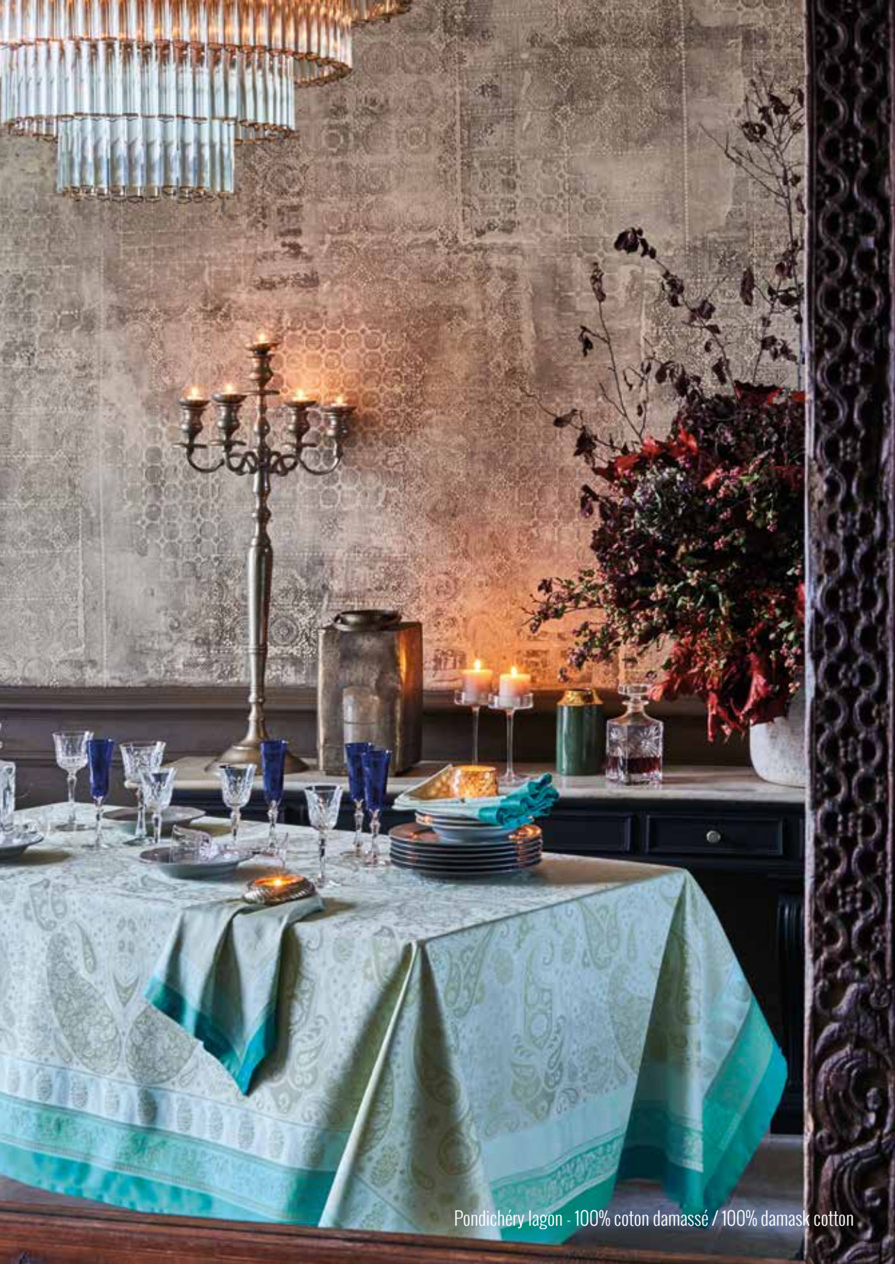
Pondichéry lagon - 100% coton damassé / 100% damask cotton