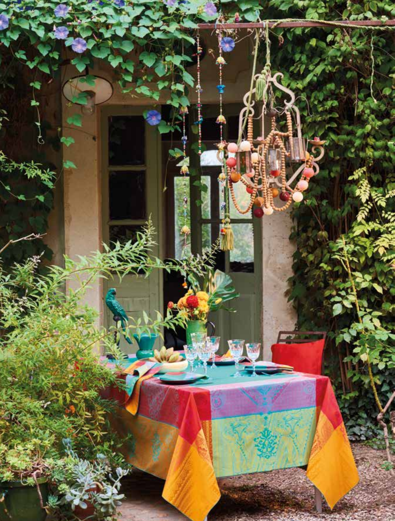
Jodhpur festival - 100% coton damassé / 100% damask cotton