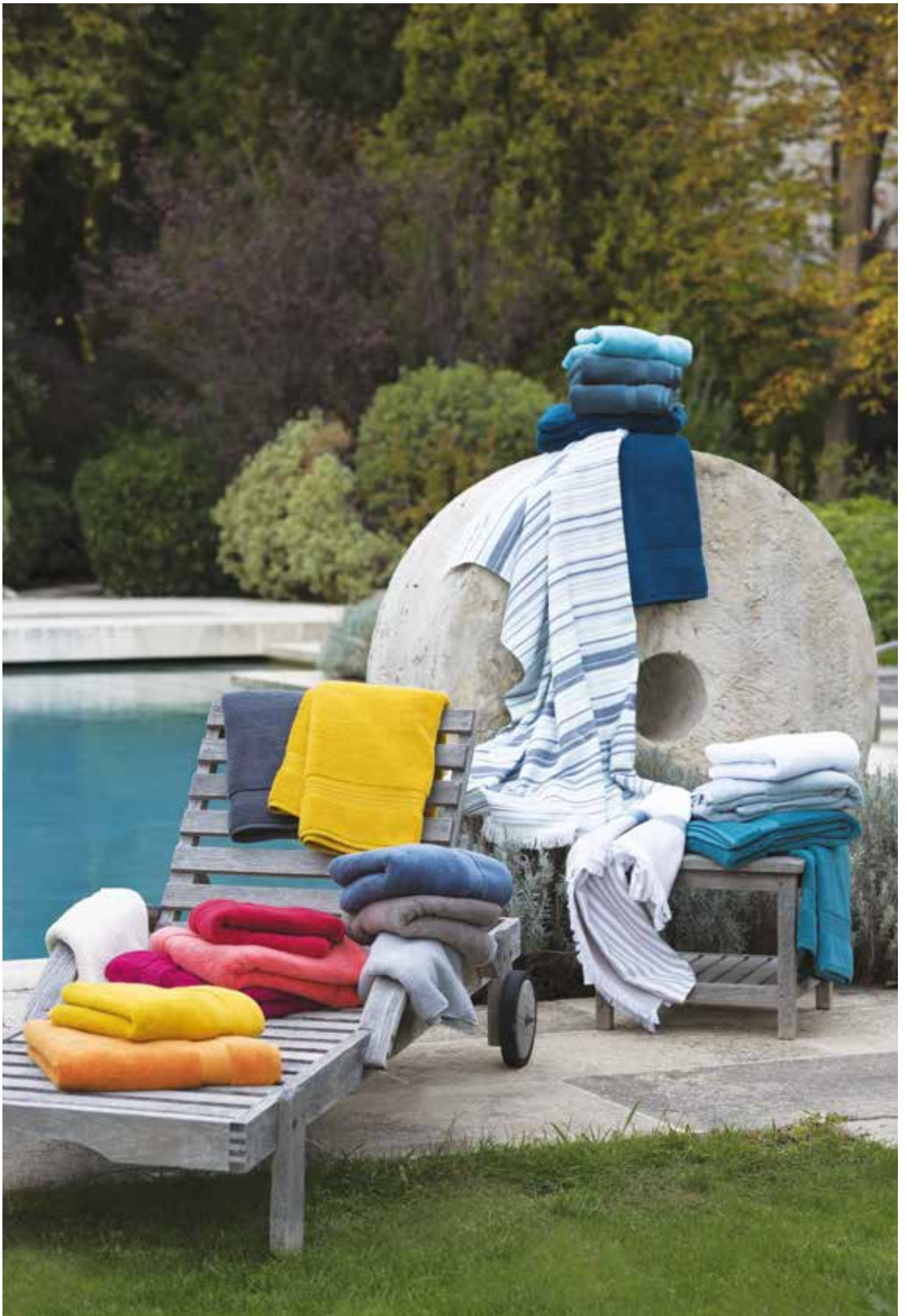
Éponge Éléa, Foutas Faro bleu & Olbia lin - 100% coton / 100% cotton