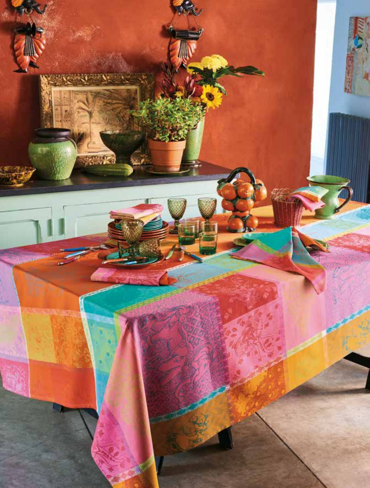
Mille holi festival - 100% coton damassé (existe en enduit) / 100% damask cotton (also available in coated cotton)