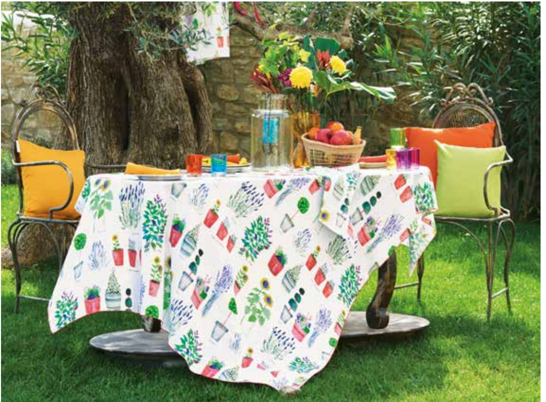
Mille fraisières printemps & Mille pépinières floraison - Métis imprimé lavé (nappes) / pre-wash printed half linen (tablecloth) Torchon & tablier - 100% coton imprimé / Kitchen towel & apron - 100% printed cotton