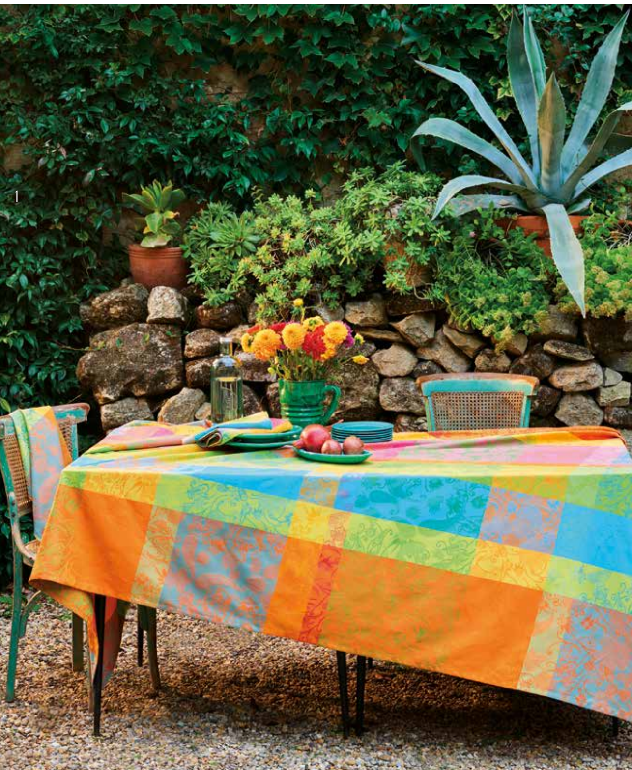
Mille india festival - 100% coton damassé (existe aussi en enduit) / 100% damask cotton (also available in coated cotton)