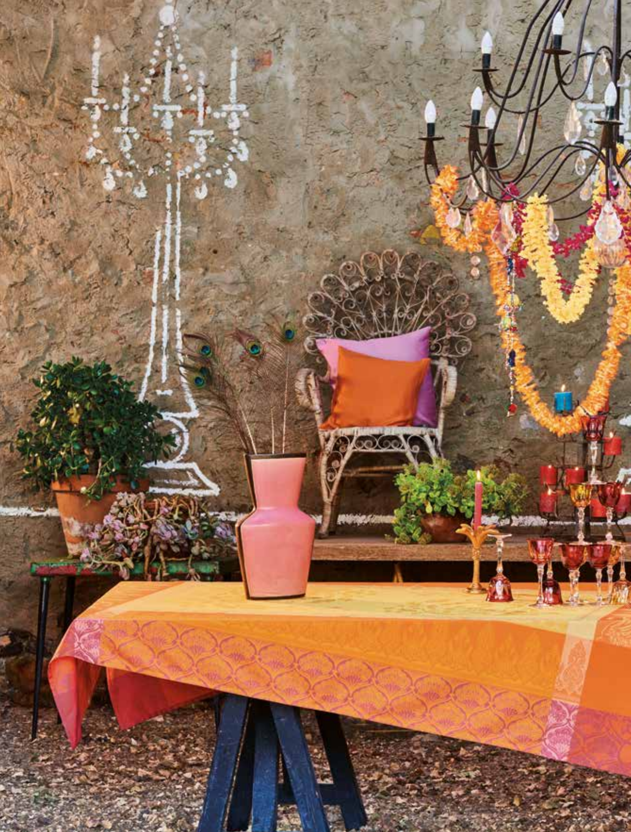
Shambala épices - 100% coton damassé / 100% damask cotton